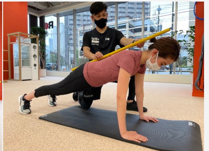
【③コンディショニングの実施】 評価に基づいて その人の特徴を踏まえたエクササイズ指導