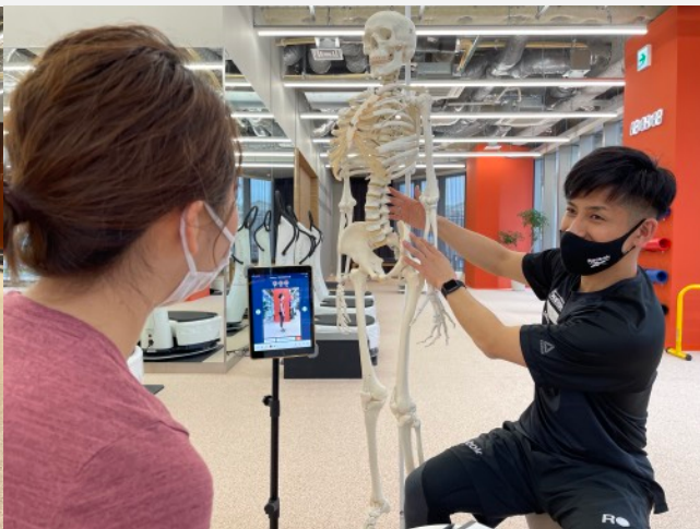
【②評価&解説】 問題のある動きの根本原因を発見し 専門的な視点で解説